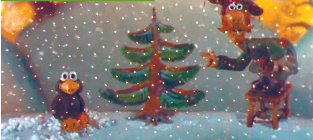
Кадр из м/ф «Падал прошлогодний снег», реж.: А. Татарский, 1983 г., www.youtube.com/soyuzmult

О плюсах и минусах натуральных и искусственных елок написано столько, что пытаться придумать что-то новое просто бессмысленно. Наши правила для тех, кто точно знает: ему нужна натуральная лесная красавица.