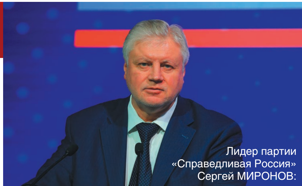
Лидер партии «Справедливая Россия» Сергей МИРОНОВ:

Депутаты от «Справедливой России» сравнили статистику: сколько товаров