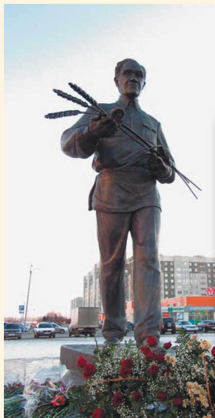
▲ Стоимость скульптуры – более 5 млн рублей. Деньги на памятник собирали всем миром.

1 млн рублей на строительство выделил лидер «Справедливой России» Сергей Миронов