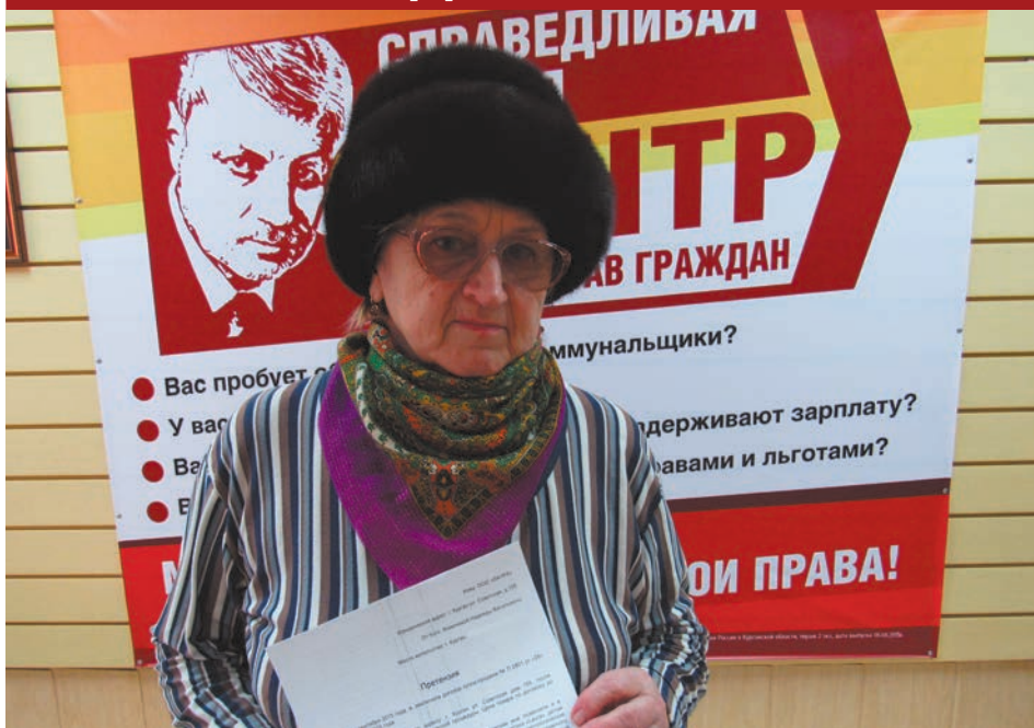
◀ Жительнице Кургана с помощью мионовского Центра удалось вернуть деньги.