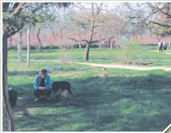
▲ Спасенный Учкеевский парк – единственная зеленая зона на Северной стороне Севастополя.

В феврале в мионовский Центр обратились неравнодушные жители Северной стороны Севастополя. В защиту парка собрали 2 тысячи подписей, которые жители передали лидеру справедливороссов Сергею Миронову. После вмешательства депутата Госдумы власти Севастополя «передумали» возводить высотки и выделили на благоустройство парка 14 млн рублей.