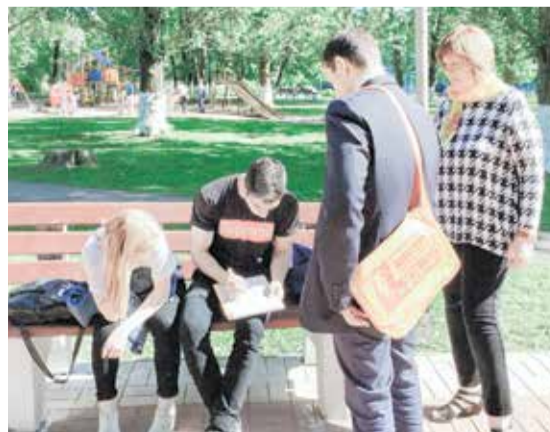
▲ Сбор проводится в Ярославле, Рыбинске и Переславле.